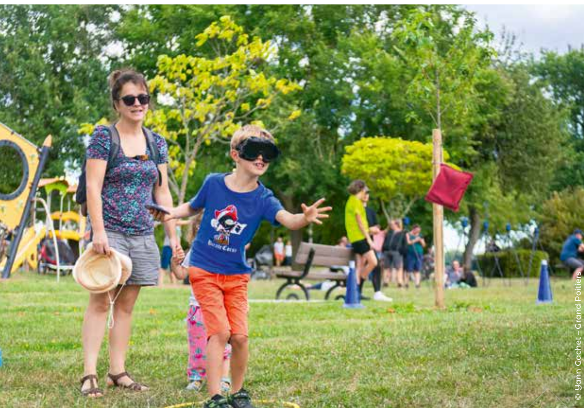
© Yann Cachet - Grand Poitiers